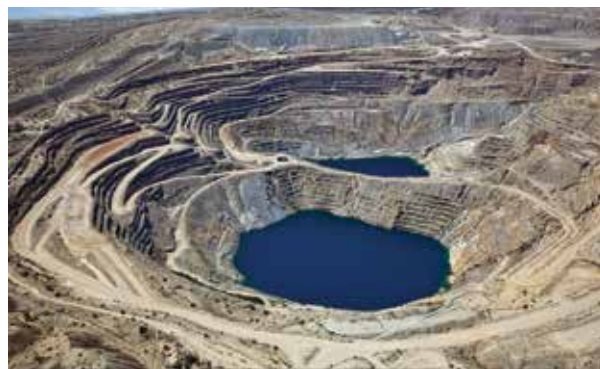
Mina de cobre a cielo abierto, abandonada cerca de Green Valley, Arizona.

La inequidad social y pobreza, así como la falta de estándares mínimos de bienestar y de educación en general –y sobre todo ambiental– incrementan la vulnerabilidad de la sociedad ante el cambio climático. Las interacciones entre el clima y los factores socioeconómicos se dan en forma circular: el comportamiento humano genera cambios ambientales, que a su vez impactan el bienestar socioeconómico y la salud pública en la región. Los hallazgos preliminares de los proyectos apoyados por Cazmex sugieren que la falta de infraestructura en las viviendas está asociada con la incidencia de casos de enfer-