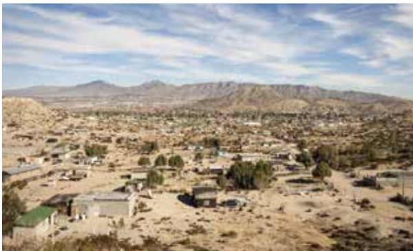
■ Rancho Anapra, una de las comunidades más pobres dentro de Ciudad Juárez, Chihuahua.

■ En este proceso de colaboración binacional hay interrogantes y desafíos enmarcados por diversos factores, como las diferencias culturales, el lenguaje, la economía y los aspectos sociales. Estas variables influyen de varias maneras en los problemas comunes para ambos lados de la frontera. Abarcar diferentes problemáticas transfronterizas en el contexto actual, local y global, como el cambio climático, es desafiante para la investigación y la comunicación. Los retos compartidos a los que se enfrentan los cien-