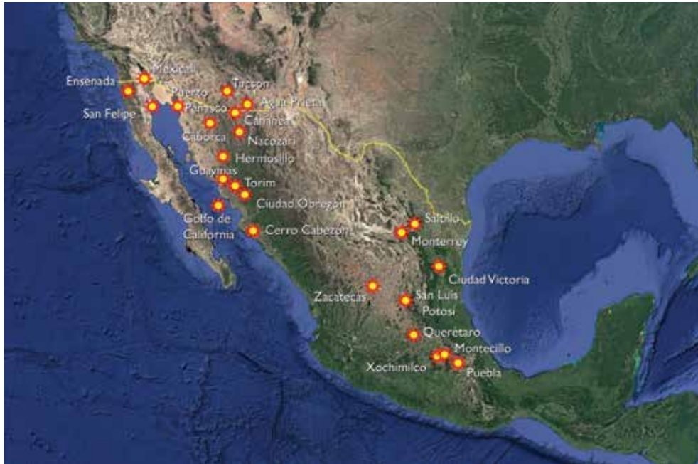
Figura 1. Mapa del suroeste de Estados Unidos y noroeste de México. Los puntos amarillos indican sitios en las zonas áridas y semiáridas en donde se han ejecutado proyectos Cazmex.